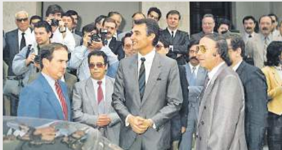
Visita ao concelho de Paredes, em 1989, do primeiro-ministro, Cavaco Silva.