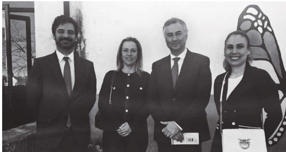
O ministro e secretário de estado da educação com a presidente da junta de Vilela

Ministro reforça compromisso com a qualificação profissional “O nosso ensino profissional preci-