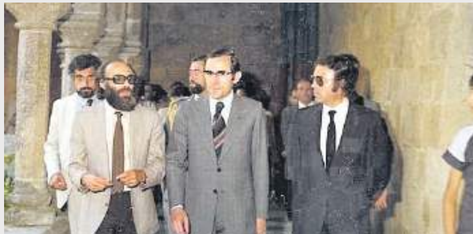
Visita de Ramalho Eanes, o primeiro Presidente da República eleito depois do 25 de abril.

Quando Paredes esteve no mapa de Portugal, os mais altos dirigentes do país gostavam de visitar o concelho.